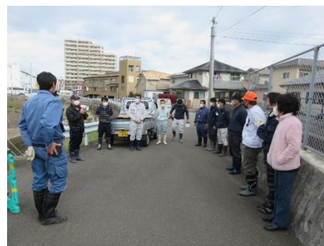
仕掛かり前のミーティング

少ない人員と正味作業時間が50分程度でしたが、収集したごみの量は150㎏で、うち金属（缶・ビン）類などの燃やせないごみは、ごみ袋（大）1つ分ぐらいでした。軽トラ1台に積み込み、長与クリーンセンターへ持ち込み処理しました。