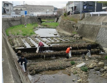
中央上方が丸田橋 時津公民館側から見る