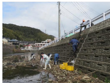
時津小学校裏の作業状況